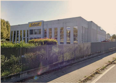
Lo stabilimento Sabell a Moncalieri (TO)