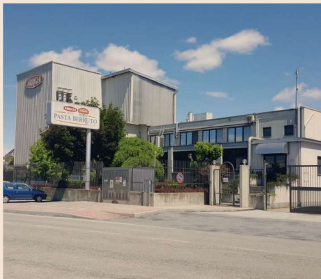
Lo sede di Pasta Berruto a Carmagnola (TO)