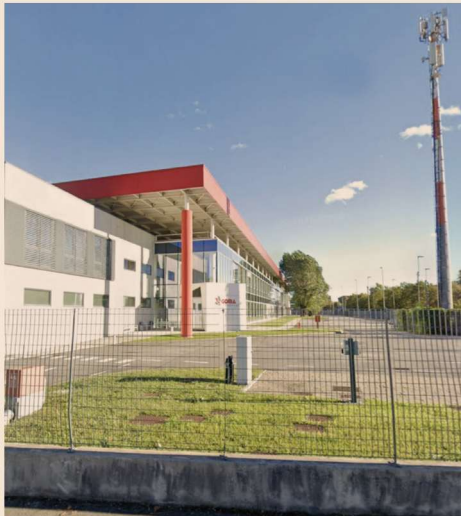
Goma Elettronica, lo stabilimento di Torino