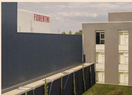
Lo stabilimento Fiorentini a Trofarello (TO)