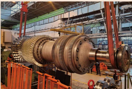
Una fase della lavorazione nello stabilimento Ethos Energy a Torino