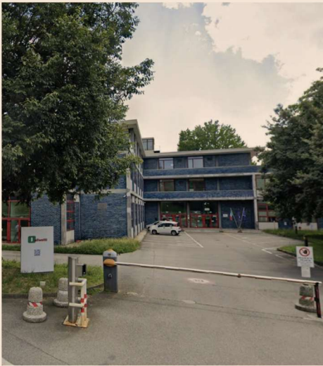
La sede Olivetti a Ivrea (TO)