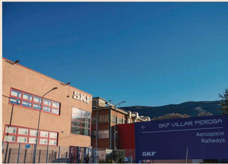
Skf, il sito di Villar Perosa (TO)