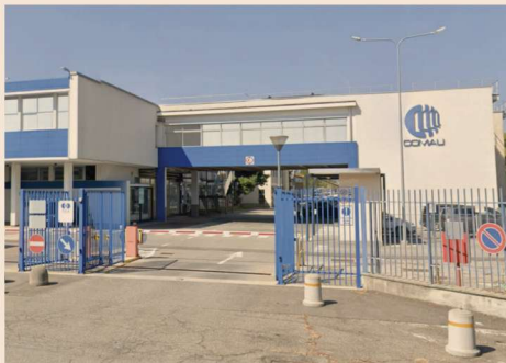
Il quartier generale di Comau a Grugliasco (TO)