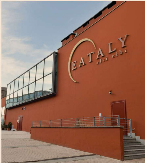
La sede di Eataly a Torino Lingotto