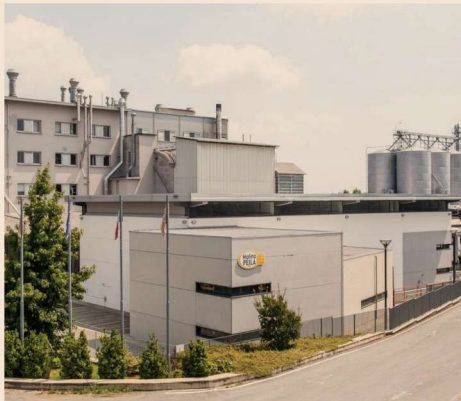
Il nuovo stabilimento di Molino Peila a Valperga (TO)