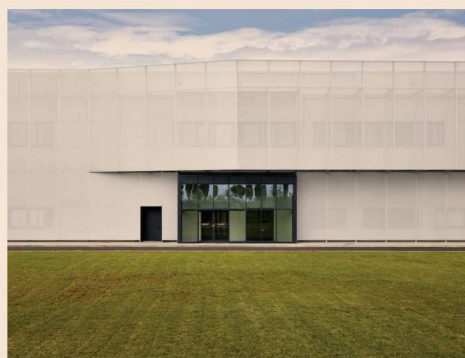
Skf Super Precision Centre di Airasca (TO)