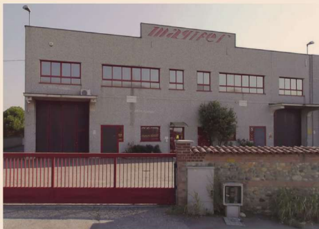
La sede di Magifer a Leini (TO)