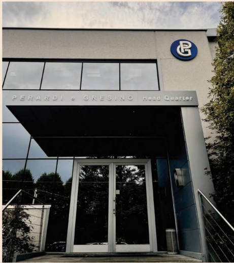
Gli uffici di Perardi e Gresino a Favria (TO)