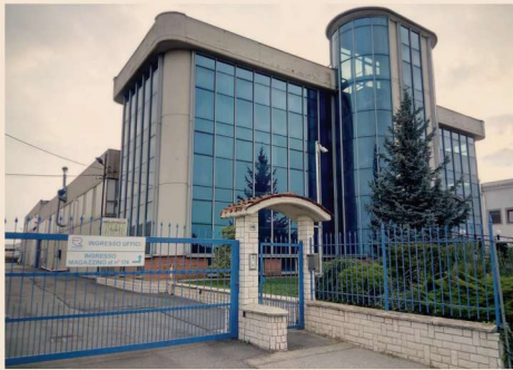
L'impianto di Ercecinque a Volpiano (TO)