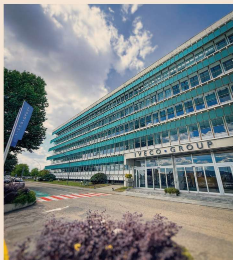
La sede di Iveco a Torino