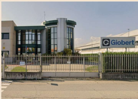
Giobert, la sede di Rivoli (TO)