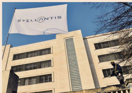
Lo stabilimento Stellantis di Torino Mirafiori