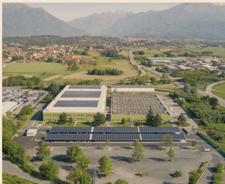
Lo stabilimento ABC Farmaceutici a Ivrea (TO)